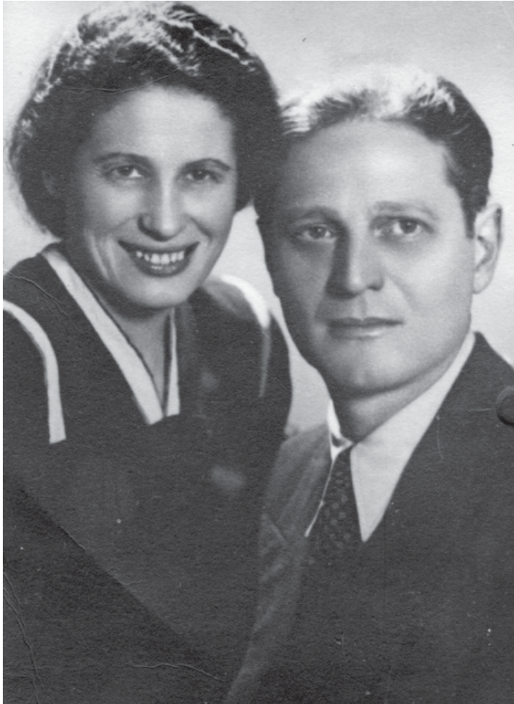
Ричард и Сабина Вурмбранд