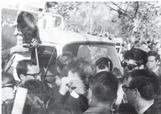
Rev. Richard Wurmbrand (above) at Pentagon being interviewed. (Below), he speaks to crowd and shows scars inflicted by Reds with knives and flame.