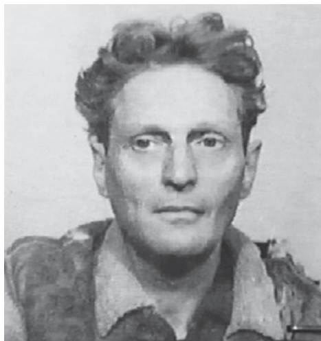
Снимок Ричарда Вурмбранда, сделанный в 1951 году в тюрьме «Тыргу-Окна».