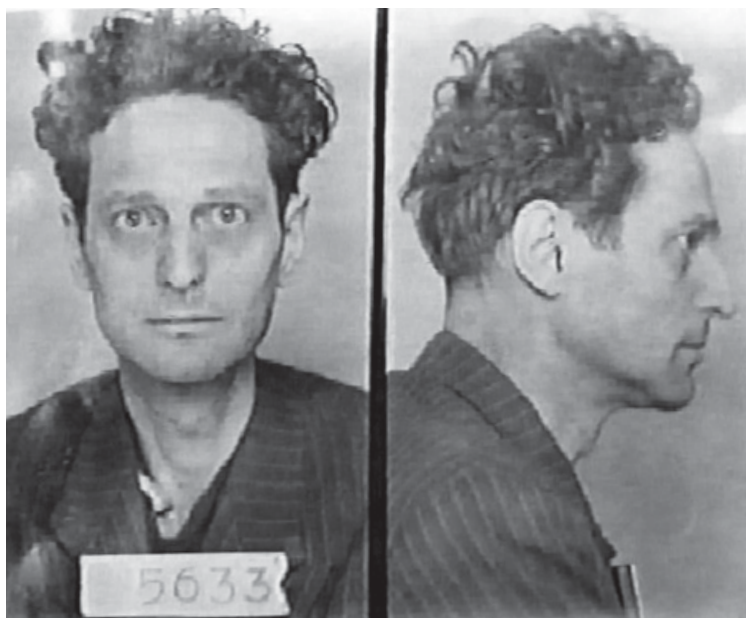
Снимок Ричарда Вурмбранда из архивов тюрьмы, сделанный после того, как 29 февраля 1948 года он был похищен с улицы Бухареста и заключён коммунистами под чужим именем.